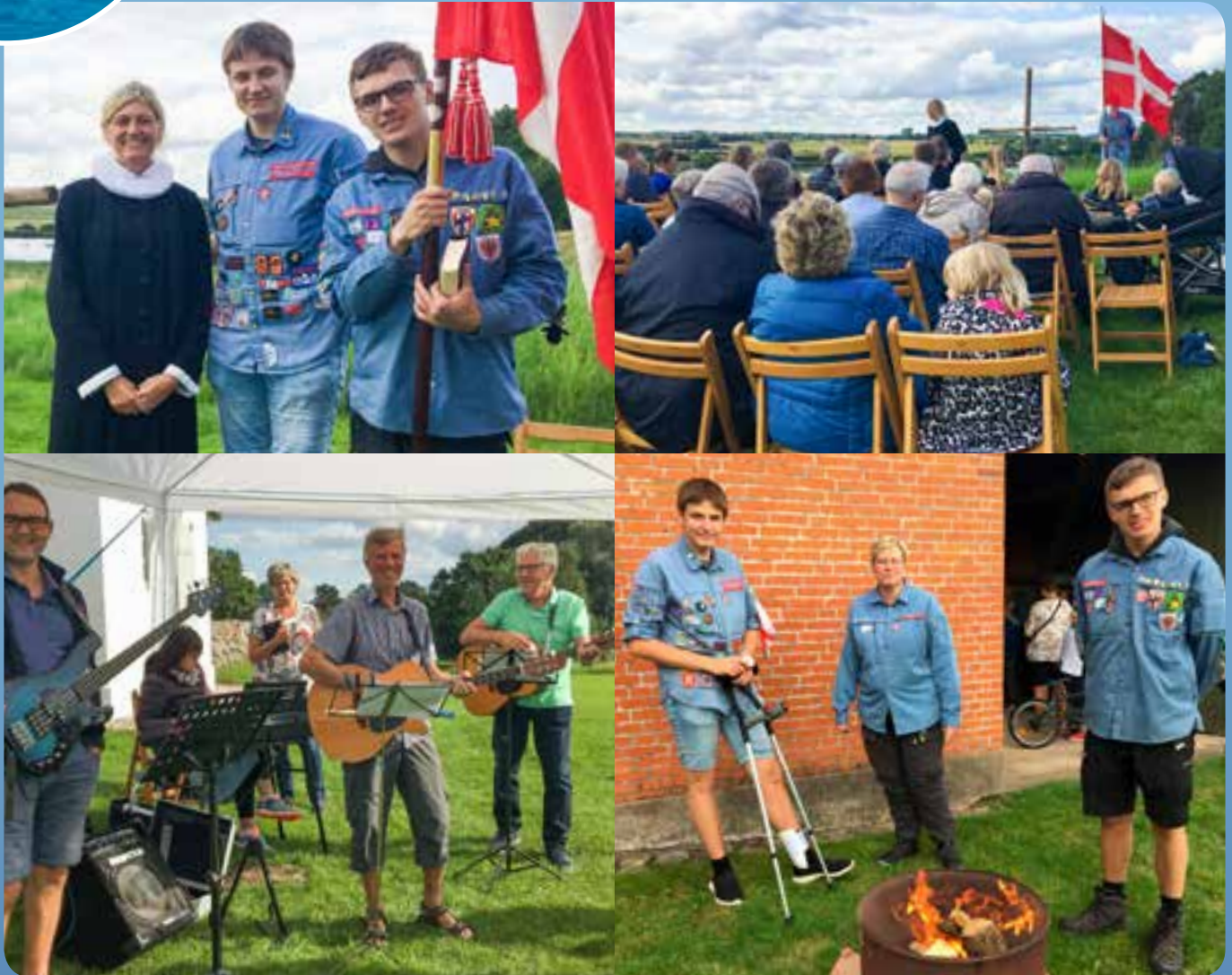
Friluftsgudstjeneste ved Egeskov Kirke august 2019