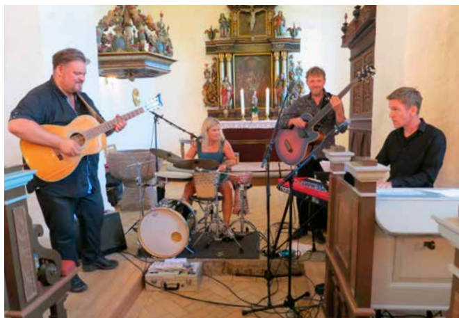
Stemning fra koncerten med Bragr den 5. juni 2018