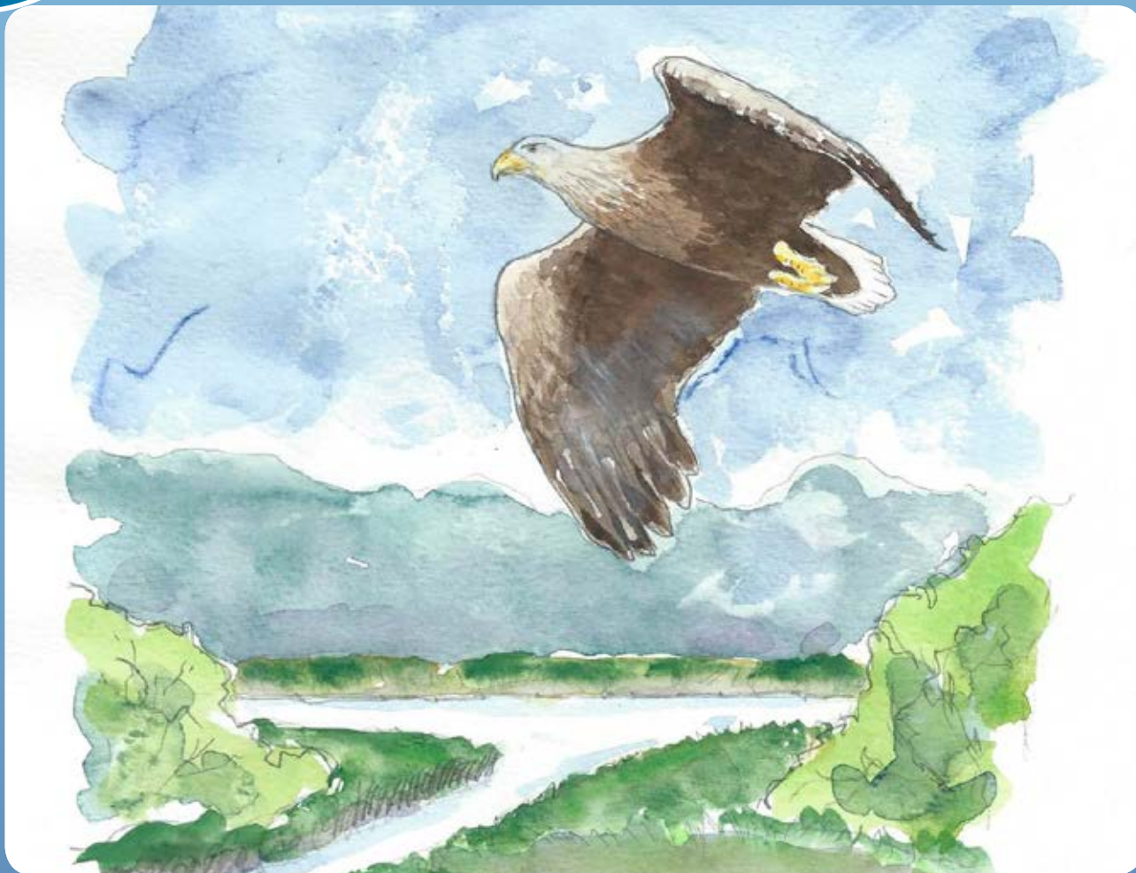
Havørn ved Rands Fjord Akvarel venligst udlånt af Preben Andersen