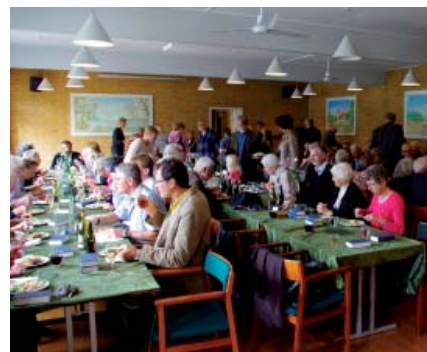
Billeder fra præsteindsættelsen af Lise Rind 10. juni 2012