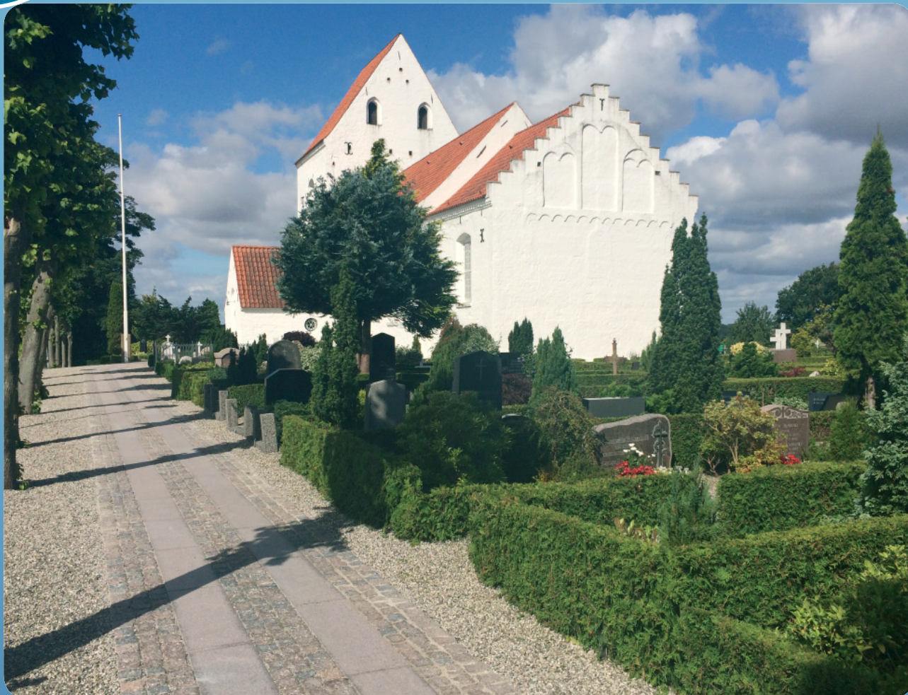
Egeskov Kirke sommeren 2016